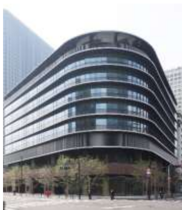
銭瓶町ビルディング