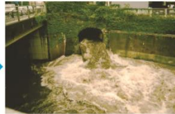
豪雨時の雨水吐口

23区の約8割の地域では、お店や家庭からの排水を雨水と一緒に流す合流式下水道となっています。豪雨のときには汚水まじりの雨水が川や海に流出することがあります。