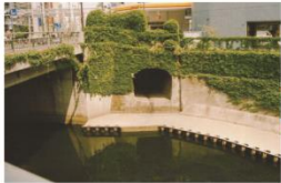
晴天時の雨水吐口