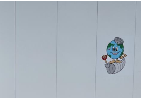
下水道局事業PR（最優秀作品：中央）