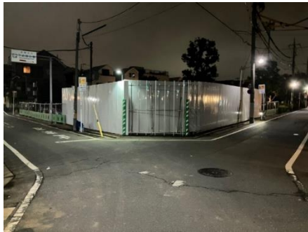
曲がり角にLED ライトを設置