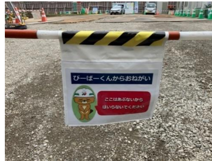
ひらがなの看板 を作成