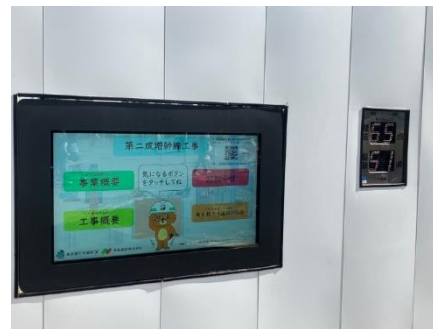
タッチ式デジタルサイネージ