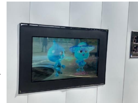
ポタンとマリンの下水道大冒険