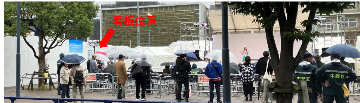
隣接公園でのイベント