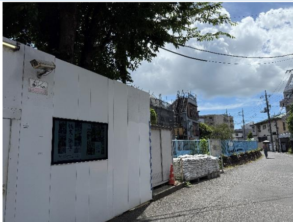
サイネージの設置場所

工事の目的や完成後のイメージを近隣住民の方々に端的に知ってもらうためにデジタルサイネージのコンテンツに工事概要動画を追加しました。