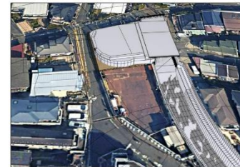
完成後の風景イメージ