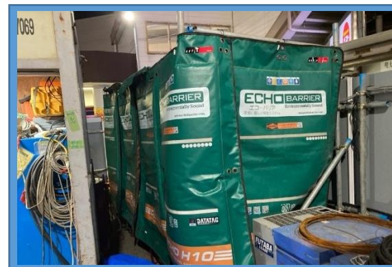
吸遮音パネルによる騒音の低減