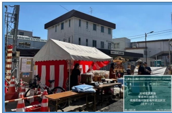
町会秋祭り会場設営