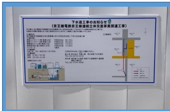
下水道工事広報板設置