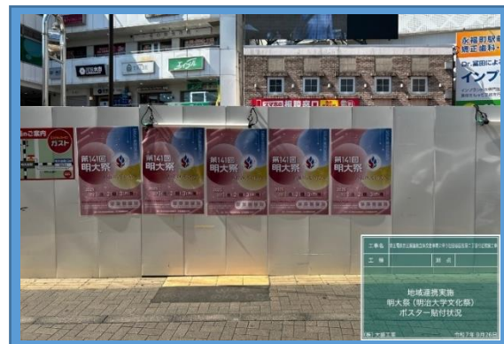
大学文化祭ポスター掲示