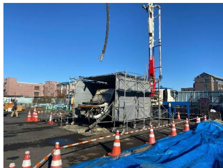
コンクリートポンプ車