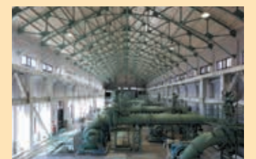
당초의 펌프실 내부

⑧ 펌프실 하수를 지하 펌프정에서 끌어올리는 펌프가 10대 설치되어 있습니다.