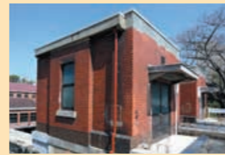
② 入口阻水门室临时屋顶 东、西各有1房，地下有维修时暂时阻止下水道水流的门。