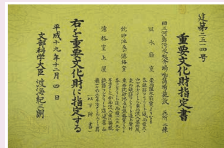
重要文化财产指定书

入口阻水门房、沉砂池等一系列构造物的原貌完整地保留下来，成为了解现代现代下水道处理场泵站设施构造的重要文化财产。