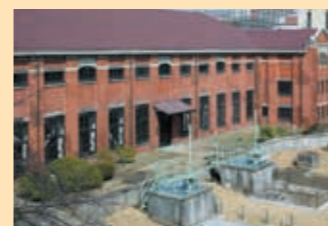
⑧ 泵房 安装的10台泵可把污水从地下的吸水井吸上来。