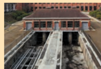
③ 沉沙池 东西各有1池，让污水在池中缓慢流动，沉淀并清除污水中的沙土。