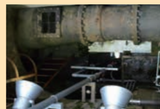
⑥ 量水器房 地下安装的文丘里流量计可测量污水量。

为何测量水量？ 为根据流入下水道水量变动水泵及后续水处理设施的洒水机的运行台数。