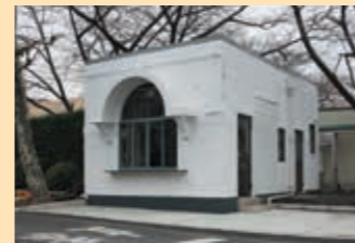
① 门卫所、正门 作为正门，建于1925年。