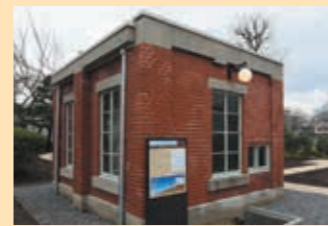
⑤ 土运车牵引装置用电动机室 安装的机器可把装有污水中清除出的沙土和垃圾的挖泥车吊上坡。