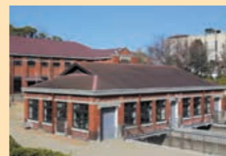
④ 滤格室棚 安装的钢网可清除污水中垃圾。