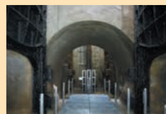
⑦ 泵井防水门室和水路 分为两个系统流入的污水在这里汇合，流入各自的吸水井。

为何测量水量？ 为根据流入下水道水量变动水泵及后续水处理设施的洒水机的运行台数。