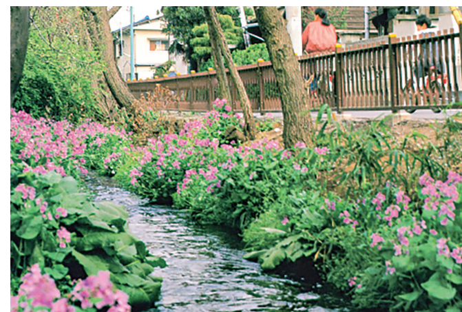
再生水による野火止用水清流復活（平成7年）