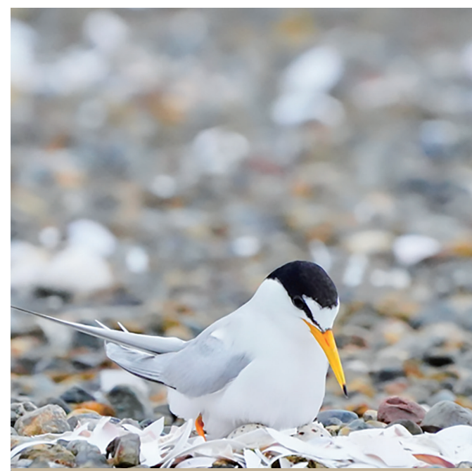
森ヶ崎水再生センター上部で抱卵するコアジサシ（令和元年）