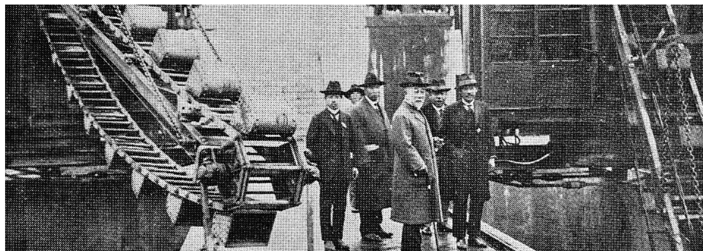
三河島汚水処分場沈砂池前（大正11年）