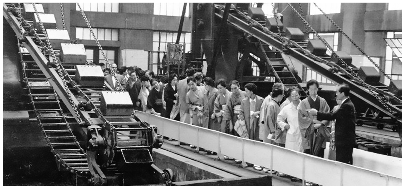
芝浦処理場施設見学会（昭和中期）