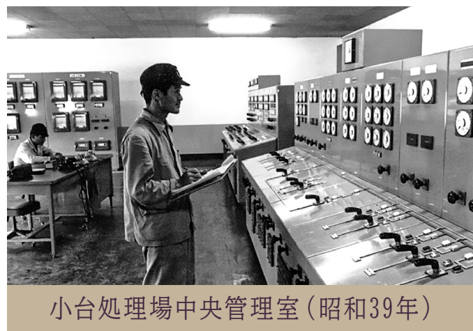
小台処理場中央管理室（昭和39年）