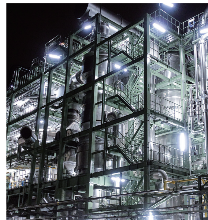
森ヶ崎水再生センター焼却炉（令和元年）