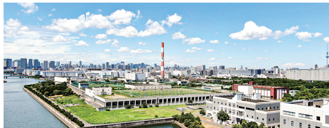
砂町水再生センター上空から（令和3年）