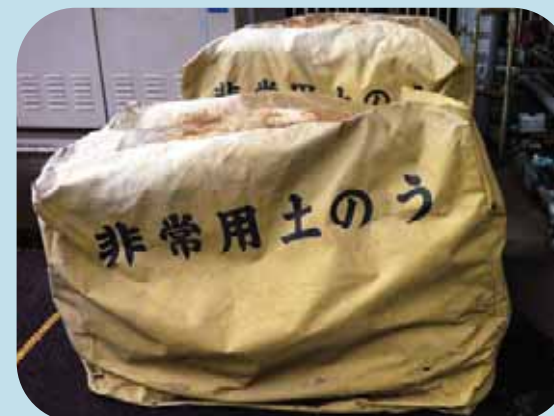
土のう(写真)、吸着マットなどの常備