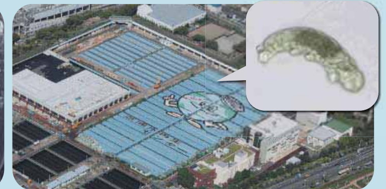
水再生センターと微生物(右上)