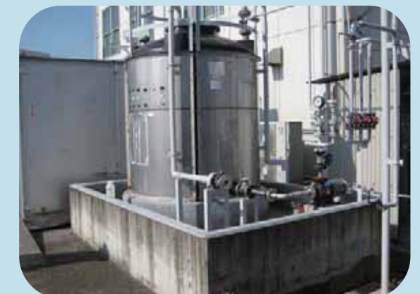
薬品タンクに防液堤を設置