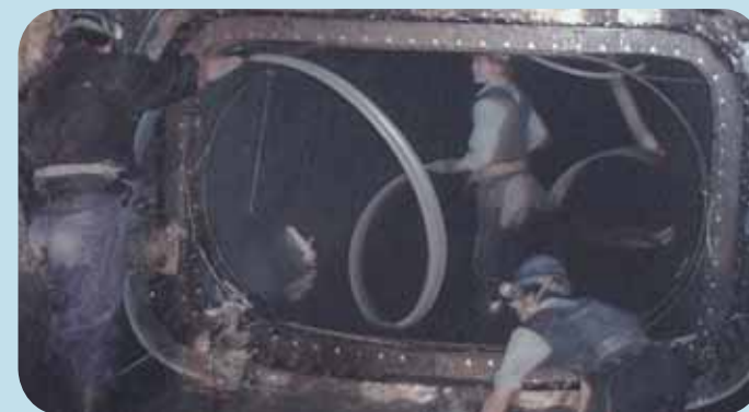
下水道管内の作業