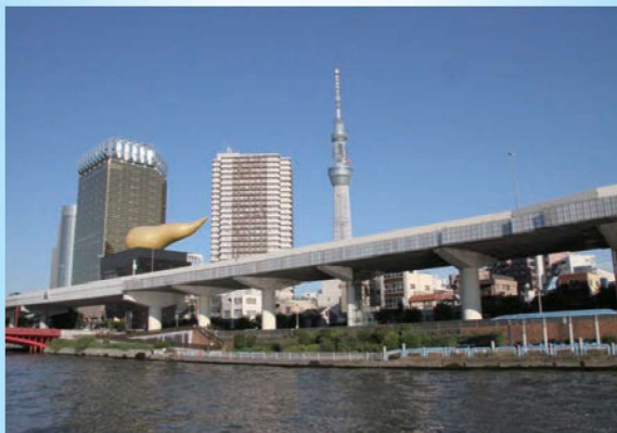
きれいになった隅田川