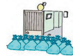
쓰레기봉투를 사용한 간이 물주머니