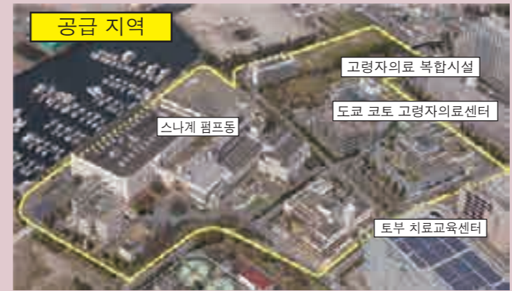
▲사업 주체는 도쿄하수도에너지 주식회사

코토구 신스나 3초메 지구의 도쿄 코토 고령자의료센터 등에서는, 스나마치 물재생센터의 처리수 및 소각로나 탄화로의 폐열을 냉난방이나 급탕의 열원으로 활용하고 있습니다. 이처럼 미이용 에너지를 활용하므로써 화석연료로 만들어진 전기나 가스를 사용할 때보다 CO 2 의 배출량이 억제되어 지구온난화 대책에 기여합니다.