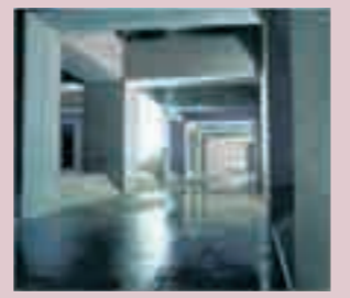
▲ 내부 모습