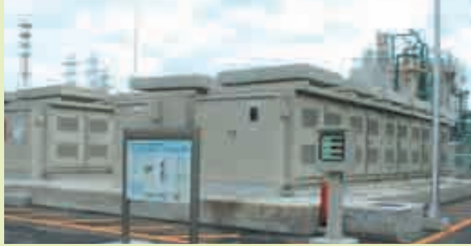
▲스나마치 물재생센터의 NaS 전지

NaS 전지는 전기 요금이 저렴한 야간에 충전하여 이 전력을 주간에 이용함으로써 전기 요금을 절감하고 있습니다. 또한, 충전한 전력은 전력 피크 시 피크 전력 억제에도 활용됩니다.