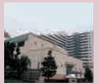
▲ 미나미스나 빗물 조정지 외관

미나미스나 빗물 조정지는 코토구 스나마치 지구 등 약 500ha 지역에 내리는 빗물을 저류하여 침수 피해의 경감을 꾀하기 위한 시설입니다. 저류된 빗물은 청천시에 스나마치 물재생센터로 이송하여 처리한 후 도쿄만에 방류합니다.