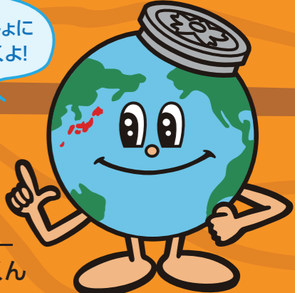
下水道局 キャラクター アースくん