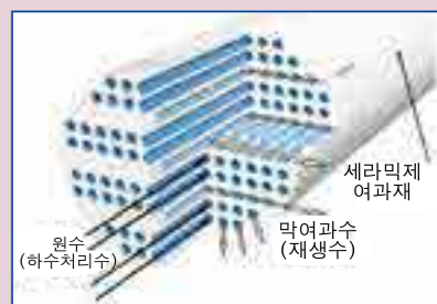
세라믹 막여과의 구조