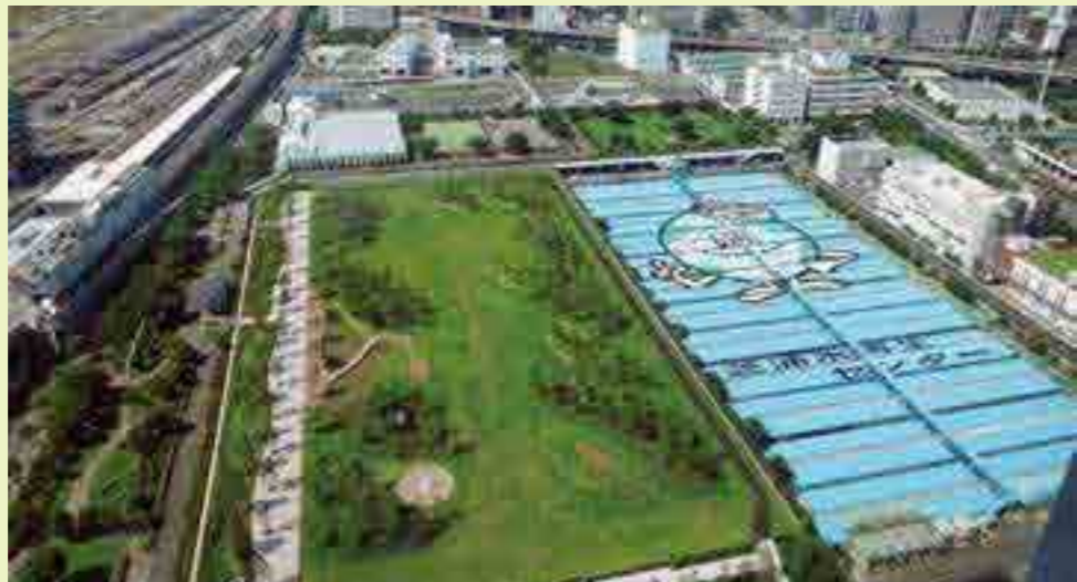
▲ 시설 상부를 시바우라췌오 공원으로 개방하고 있습니다