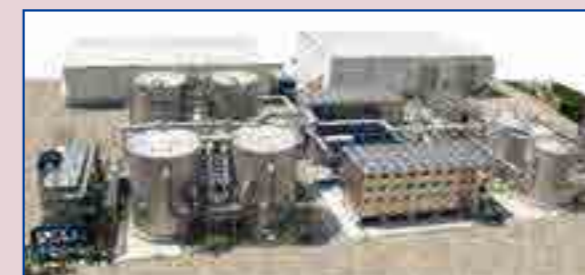
세라믹 막여과에 의한 재생수 제조시설